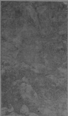
Solfataras entre las peñas

Allí se les dijo que la ascensión a la cumbre del volcán Miravalles era muy penosa y molesta y que no tenía interés de unos once metros de altura.