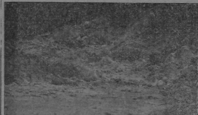
Conjunto de solfataras

na de boquillas por las cuales se escapan gases que mantienen el agua en un movimiento semejante al de la ebullición.