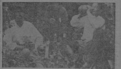
Almuerzo en la cúspide

Siguiendo el curso a algunos kilómetros de las boquillas que saturan el agua del río de alumbré y magnesio, le cae otro afluente, que es el Río Agrío, cuyas aguas están muy cargadas de ácido sulfúrico y entontecidas todas las sustancias en suspensión en las aguas se