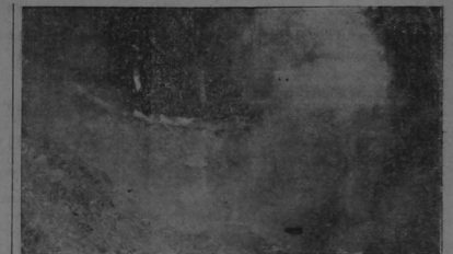
Una nueva solfataras

A eso de las once de la mañana, siguieron por la selva virgen, ascendiendo en busca del espinazo del macizo volcánico, conocido con el nombre con el gráfico nombre de el Filete. Cortando transversalmente y ascendiendo en precipitada pendiente, llegaron al Filete y por allí siguieron en busca de la cima del cerro. El filete es ancho al principio y luego va