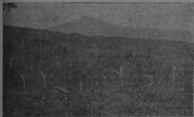
El volcán Miravalles visto de lejos

Las maravillas de la naturaleza: un río que cambia de colores